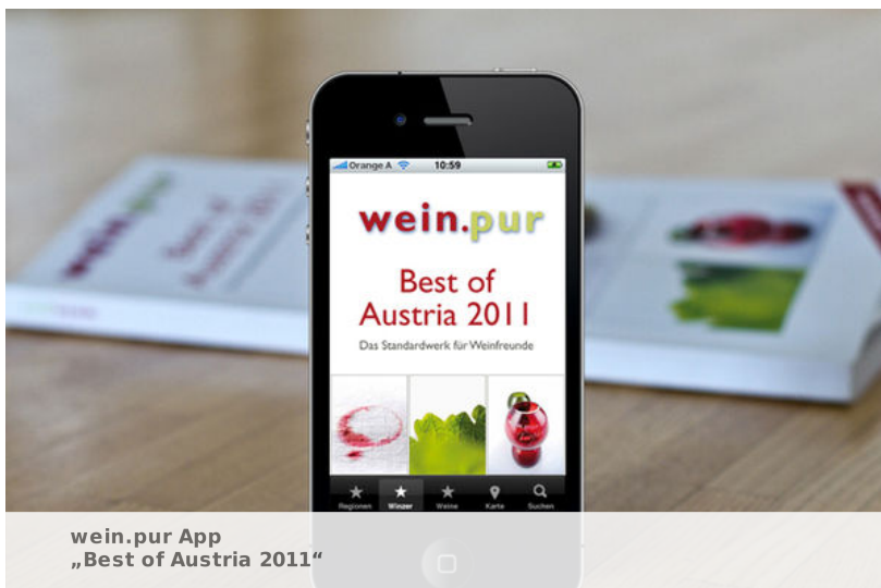
wein.pur App „Best of Austria 2011“